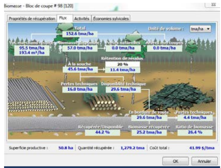
Figure 1 : Exemple de disponibilité technique de la biomasse sur un parterre de coupe

Les volumes disponibles doivent être évalués par essence et par type (résidus de coupe ou billes de faible valeur) dans un rayon donné autour de l'usine de transformation. Il faut se rappeler que la distance de transport de la biomasse est un facteur important, la valeur déclinant rapidement avec l'augmentation de la distance. Le logiciel FPInterface et le module BiOS 1 sont des outils tout désignés pour évaluer ces volumes sur un territoire donné. Ils prennent en considération l'inventaire forestier, mais aussi la disponibilité technique, c'est-à-dire ce qui est techniquement récupérable selon le système de récolte utilisé (bois court, bois long ou arbres entiers) (Figure 1).